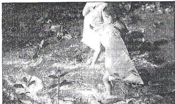
ARDUO. El trabajo de limpiar las márgenes del curso de agua no fue para nada fácil, pero los jóvenes pusieron toda su mejor energía para lograrlo.

• Participaron en una jornada de talleres en la escuela de salud O'paybo • Aprendieron sobre la importancia del reciclaje y la selección de los residuos •