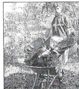
RECOLECTOR. Una carretilla sirvió para trasladar las basuras más pesadas que sacaron del arroyo.